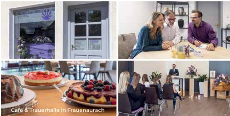
Café & Trauerhalle in Frauenaaurach