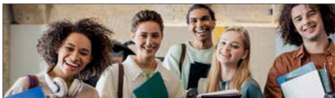
Fachschule für Heilerziehungspflege Herzogenaurach GGSD

Herzogenaurach – Am Samstagvormittag wurde ein am Martin-Luther-Platz geparkter Pkw von einem unbekanntem Täter angegangen. Trotz der Tageszeit schlug der unbekanntem Täter die Scheibe der Beifahrertüre ein und entwendete einen Einkaufskorb samt Inhalt, sowie ein Mobiltelefon. Im Anschluss flüchtete dieser. Hinweise an Tel. 09132/7809-0.