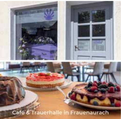
Café & Trauerhalle in Frauenaaurach

Die Aussegnungsfeier findet am Freitag, den 6. Februar 2026, um 13.15 Uhr auf dem alten Friedhof in Herzogenaurach statt. Von Beileidsbekundungen bitten wir Abstand zu nehmen.